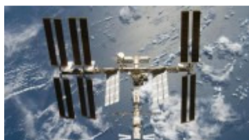
A Szojuz elérte a Nemzetközi Űrállomást