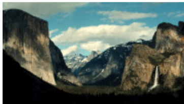
Videó a Yosemite Nemzeti Parkról