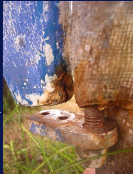
Szinte minden javításra szorul....

"Talán könnyebben meg lehet érteni Fidzsit, ha van kell házibuli- tapasztalatunk