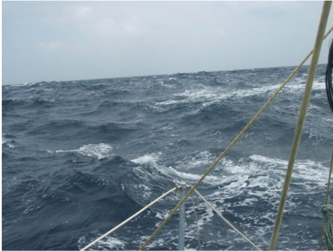
Elég zötyögős a hajózás az "összevissza" hullámokon (ahogy Áron nevezte el őket)