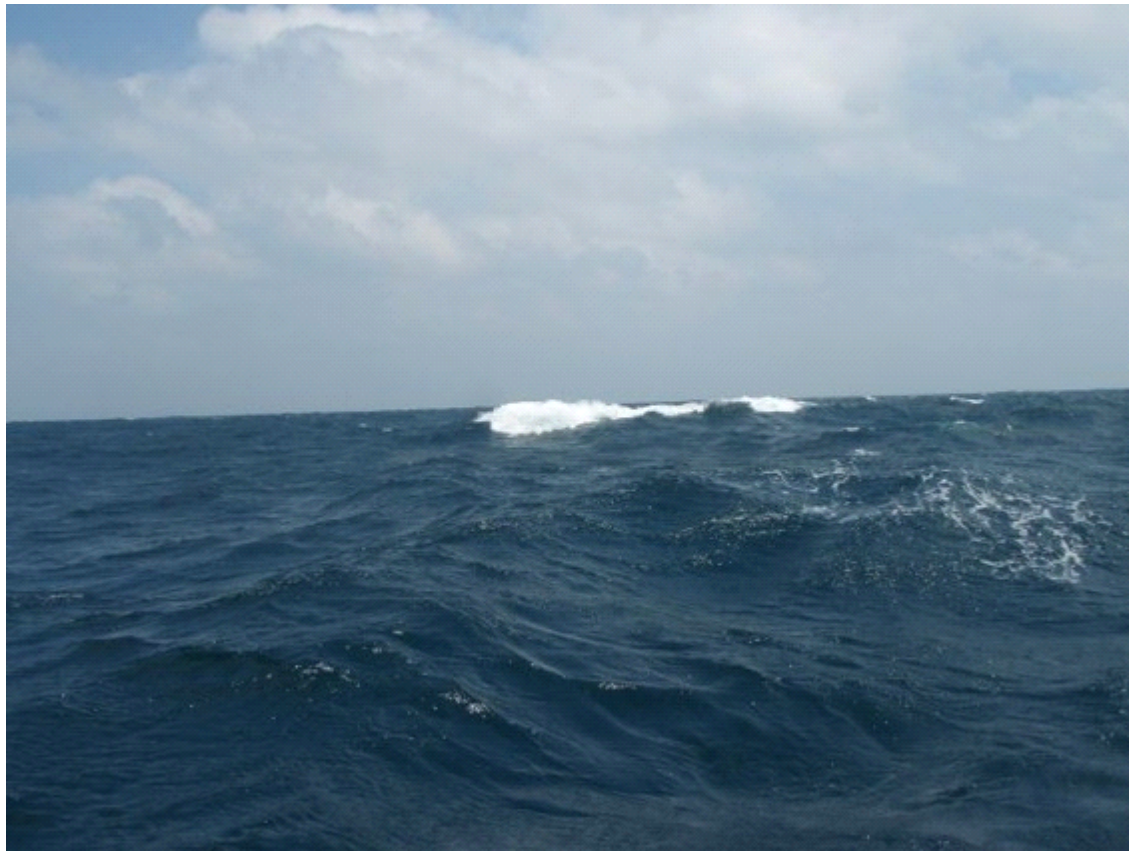
Tarajos hullám kialakulása