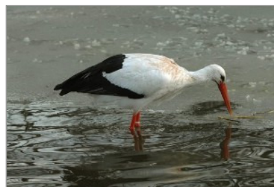
Gólya a télben